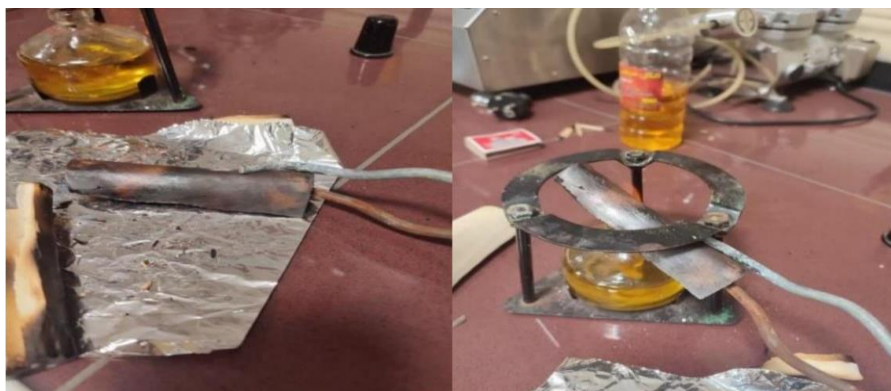
شکل ۲: سوزاندن استخوان

قلم گاو (یا هر استخوان در دسترس)، هاون چینی (یا دستگاه آسیاب گلوله ای)، شعله، کوره (از فر نیز می توان استفاده کرد)، رزین و هاردنر، همزن مغناطیسی.