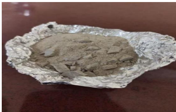
شکل ۳: نانو ذرات هیپوکسی آپاتیت بدست آمده

در ادامه استخوانهای بدست آمده را به مدت یک ساعت در دمای ۸۵۰ درجه سانتیگراد در کوره قرار داده تا تمام مواد کربنی آن حذف شود (یا آن که به مدت بیشتر با دمای ۲۰۰ درجه داخل فر قرار دهید).