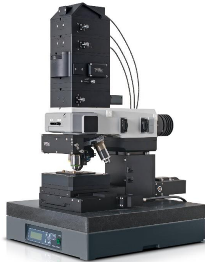
شکل ۱- میکروسکوپ نیروی اتمی (AFM).

نانوفناوری و علم مواد ایفا می کند. امروزه دستگاه های تجاری متفاوتی با مبانی مشابه و حالت های کاری مختلف عرضه شده اند که از نظر دقت و کیفیت تصاویر با یکدیگر تفاوت دارند.