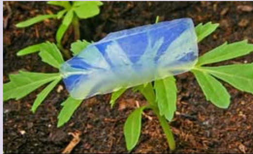
نمایش ضریب انکسار کم آتروژل

خواص شیمیایی این ساختارها بیشتر وابسته به نوع گروه‌های سطحی است که طبیعت آبدوست بودن یا آبگریز بودن آن را تعیین می‌کنند.